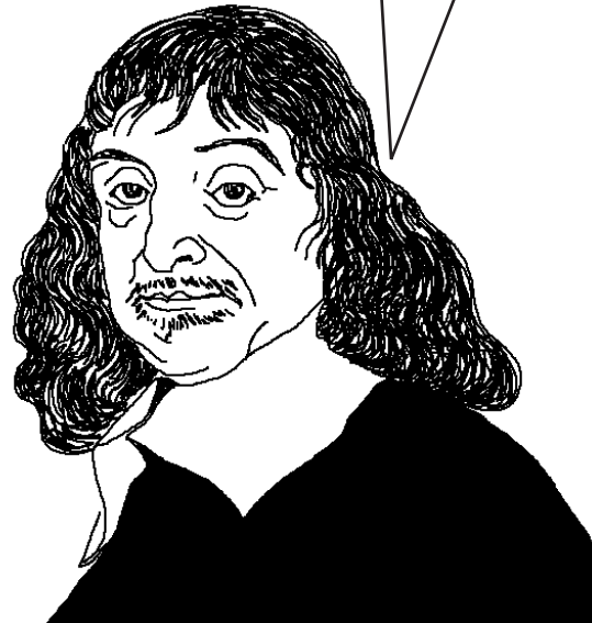
رنه دکارت فیلسوف فرانسوی (۱۶۵۰-۱۵۹۶)

انسانها واجد روح هستند پس مستعد رنج کشیدن می‌باشند و درد را احساس می‌کنند. اما از آن جا که حیوانات روح ندارند در نتیجه درد را حس نمی‌کنند. اگر می‌بینید که حیوانات نسبت به برخی اعمال واکنش نشان می‌دهند و ناله و فریاد می‌کنند این اصوات عکس‌العملی غیر ارادی است که آنها در این موارد از خود نشان می‌دهند مثل صدای فنر در ساعت!