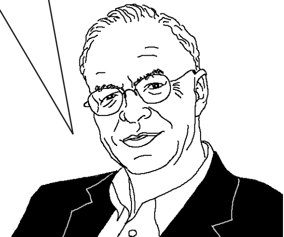
پیتر سینگر فیلسوف معاصر استرالیا (۱۹۸۶)

وقتی ما تصور کنیم حیوانات فاقد شأن اخلاقی هستند یا وضعیت اخلاقی پست‌تری نسبت به انسانها دارند، در واقع به نوعی تبعیض به نام تبعیض اخلاقی، شبیه آنچه در بین نژادپرستان یا افراد معتقد به تبعیض جنسیتی وجود دارد، دچار شده‌ایم. اصرار من بر این است که ما باید اصول پایه مساوات را (که اغلب معتقدیم باید در میان تمام اعضای گونه بشر گسترش داده شود) به سایر گونه‌های جانداران نیز بسط دهیم. نژادپرستان وقتی احساس می‌کنند مابین منافع خودشان و منافع افراد متعلق به سایر نژادها، تقابلی وجود دارد، به هواداری از هم نژادهای خود پرداخته و به این نحو اصول تساوی حقوق را نقض می‌نمایند. همین امر در مورد گونه پرستان نیز صدق می‌کند. آنها نیز منافع افراد گونه خود را بر منافع اعضای سایر گونه‌ها ترجیح می‌دهند. [متأسفانه] الگو در هر دو مورد مشابه است.